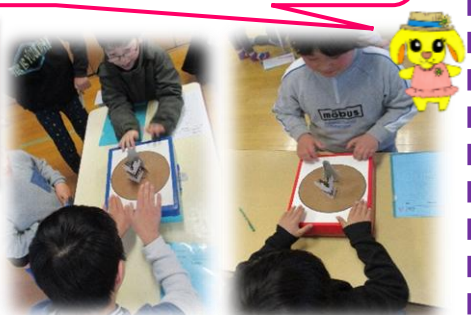
さんかしょう 参加賞:じょうぎだよ！

だいいちじどうかん こうれい かみずもうたいかい せんしゅうらく ひょうしょうしき おこな 第一児童館恒例の紙相撲大会千秋楽をむかえ表彰式を行いました