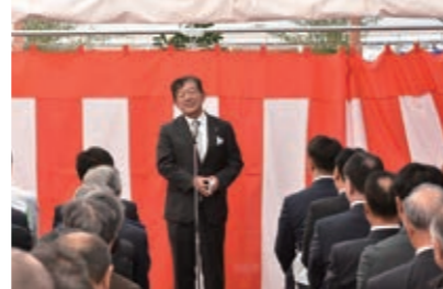
▲起工式の様子。関係者で工事の無事を祈願しました。