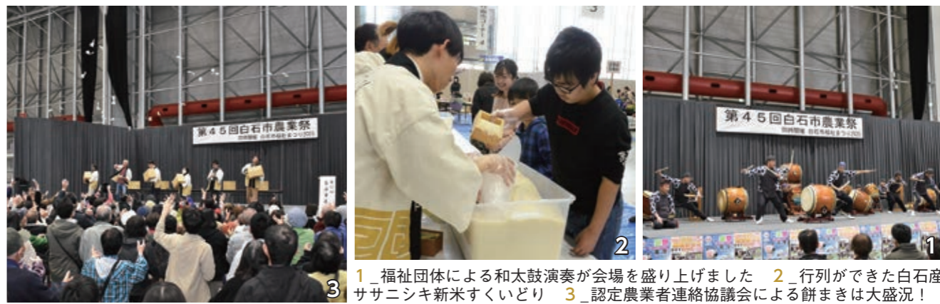
1_福祉団体による和太鼓演奏が会場を盛り上げました 2_行列ができた白石産ササニシキ新米すくいどり 3_認定農業者連絡協議会による餅まきは大盛況!

11月6日、第二幼稚園で毎年恒例の焼き芋会が行われました。園児たちが心を込めて育てたサツマイモを、畑の先生や南町長寿会の皆さんと一緒に焼き上げました。できたてホクホクのサツマイモをほおばり、「甘くておいしい!」と笑顔いっぱいの子もたち。秋の味覚を通して、地域とのふれあいも深まる楽しいひとときとなりました。