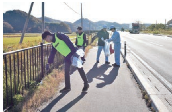
▲国道4号線で清掃活動を行う参加者たち

評一 一首目、仕事の合間の一寸した感を逃さずに詠んで居られる。二句と三句との繋ぎが巧い。 二 一首目、初句、破調だがこれでいい。頑張ろうは付き添う作者の心の内。 三 一首目、「堤体壁」は専門用語。ダムの表の巨大な壁。三句目が、茂く這うに密接。 評一 一首目、クマ出没に国までが対策に乗り出す現実。木の突の大凶作が原因とも言われる。「クマだっって好きで出て来るわけじゃない」。 二 一首目、体温より高い気温の日もあった今年の夏。吸った息を冷やして吐く表現に、暑さに閉口している様子が表れている。 三 一首目、人は寝て育てると言われる。「して見せて言っただけで育ててみよ。寝てやらねば人は育たず」とか。