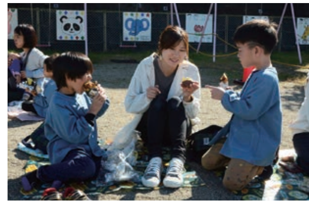
▲親子でホクホクのサツマイモを堪能

11月14日、社会問題化している国道4号越前・斎川地区の尿入りペットボトル問題を解消しようと、4回目となる白石蔵王エコフォーラムによる清掃ボランティア活動が行われました。この日は、構成企業や市職員など30人が参加。尿入りペットボトル105本を含む可燃ごみ約60キロを回収しました。