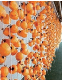
▲オレンジ色の鮮やかな「柿のれん」